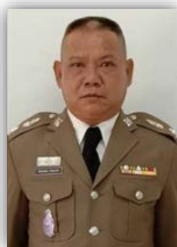
พ.ต.ท.ประกอบ กรมกอง รอง ผกก.สืบสวนสภ.เวียงต้า กรรมการ กต.ตร. อาชีพ รับราชการ